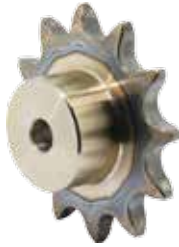
双节距滚子链链轮R型